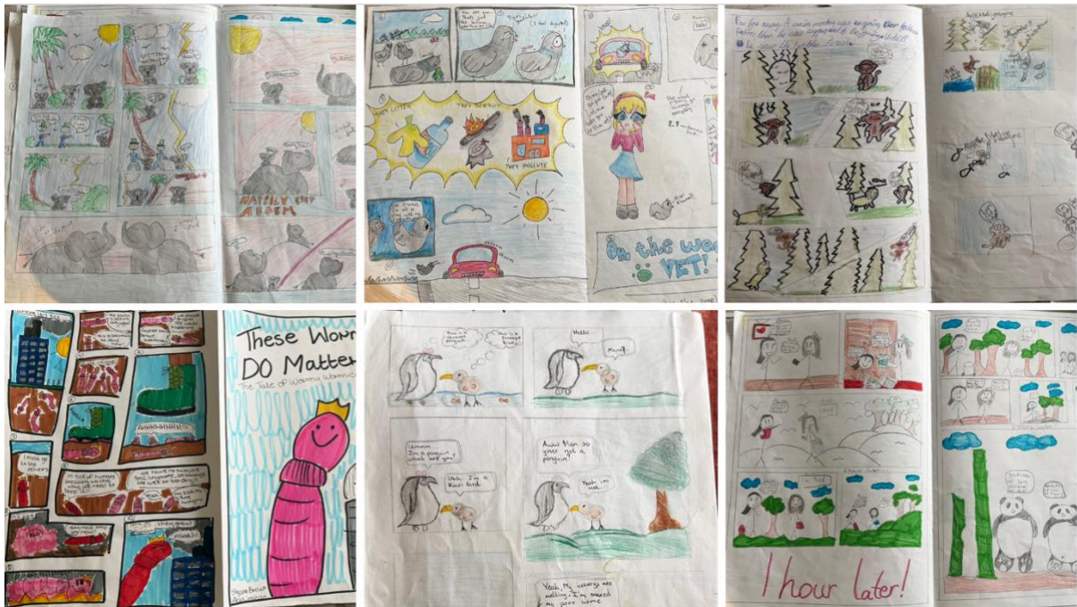
Samplaí ó dhaltáí eile ón gColáiste Nano Nagle, Coláiste Éamann Rís, Bunscoil St Maries of the Isle, i gCathair Chorcaí go léir.