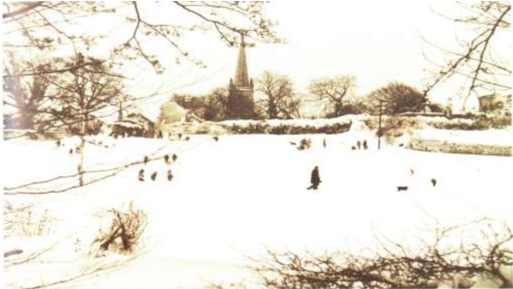
The exceptional snow of January 1982 (Photo: scene at Rathfarnham, county Dublin, by P.A. O'Dwyer)

1987 Thosaigh an seal seo ar an 11 Eanáir. Faoin 14ú, tuairiscíodh go raibh sneachta trom tite go háirithe san Oirthear agus i Lár na Tíre. Mar gheall ar ghaotha measraithe anoir aduaidh tharla síobadh sneachta. D'ardaigh teochtaí beagán os cionn an neamhní ar an 15ú lá agus ansin thosaigh sé ag leá. Tharla an titim is mó de shneachta sna háiteanna seo a leanas: Aerfort Bhaile Átha Cliath 19 cm; Aeradróm Mhic Easmainn 12 cm; Biorra 12cm; An Muileann gCearr 12 cm. Ag Rinn an Róistigh taifeadadh an doimhneacht ba mhó sneachta 12 cm agus íosteocht de -7.2 céim Celsius, an teocht is ísle a taifeadadh san áit sin ó tosaíodh ag glacadh taifead sa bhliain 1867.