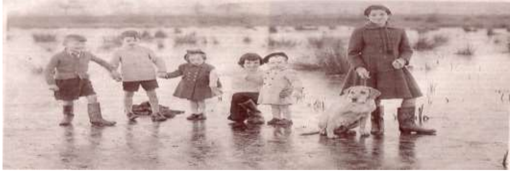
An tSionainn ar an 3 Eanáir 1963

lean seo ar aghaidh gan ach cúpla tréimhse ghearr níos boige go dtí lár mhí an Mhárta. Le linn na tréimhse seo ghluais gaotha anoir thar Éirinn mar thoradh ar fhrithchionclón ó Chríoch Lochlann, le lagraigh ó am go chéile ag breith leo sneachta, agus bhí roinnt den sneachta sin trom. Ar mhaidin an 31 Nollaig 1962, taifeadh doimhneacht de 45 cm sneachta ag Aeradróm Mhic Easmainn i limistéar nach raibh aon síobadh suntasach ann.