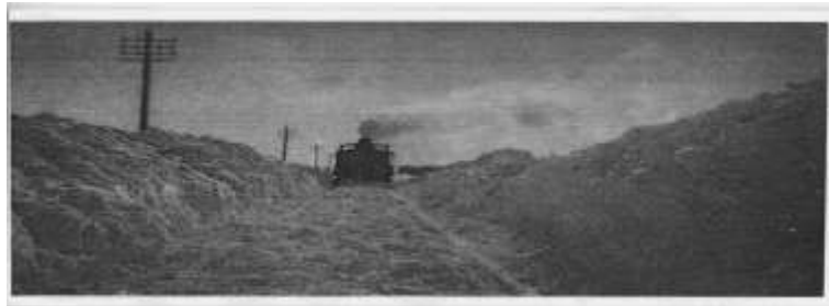
1947 Inneall gaile ag teacht isteach i Stáisiún Mhainistir na Búille

Sna míonna ag tús na bliana 1947 bhí ceann de na tréimhse is faide d'fhuacht a tharla sa chéad, agus sneachta ag titim i bhformhór na tíre ó dhéanach i mí Eanáir go dtí lár mhí Márta. Cé go rabhthas tar éis sneachtaí indibhidiúla níos troime a thuairisciú, go háirithe i mí Eanáir 1917, ní raibh aon am eile cóngarach don am ina raibh aimsir chomh fuar ann a mhair ar feadh tréimhse chomh fada. Tar éis fómhar tubaisteach sa bhliain 1946 agus síneadh a bheith curtha le ciondáiil bia agus breosla mar gheall ar an gcogadh, bhí an saol an-dian do dhaoine ar fud na tíre sa mhéid go raibh cur isteach ar shaoráidí cumarsáide agus iompair ar feadh cúpla seachtain. Faoi thús mhí Feabhra bhí daoine ag scátáil ar lochanna reoite agus lean an fuacht gan staonadh go dtí lár mhí Márta.