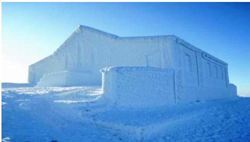
Oighear agus sneachta mar chúlach bán ar Chruach Phádraig, Co. Mhaigh Eo, ar Lá Caille 2010.

feadh 5 nó 6 lá, cé go raibh sé fós fuar, ach d'éirigh sé thar a bheith fuar arís ón 16ú lá le sneachta ag tabhairt leis carnadh mór agus teochtaí Nollag nach bhfacthas a leithéidí. Taifeadadh doimhneachtaí sneachta de idir 10 agus 25 cm ag roinnt mhaith áiteanna. Ag Aeradróm Mhic Easmainn b'ionann an doimhneacht agus 27cm.