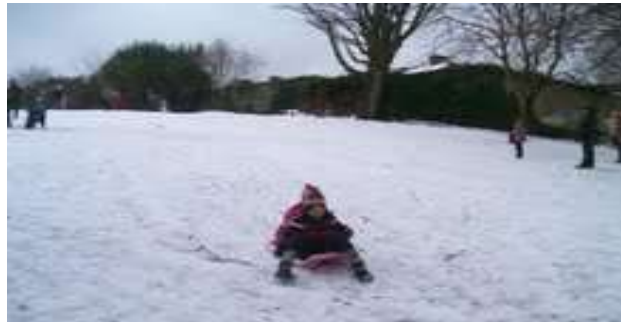
Nollaig 2010, Páirc Uí Ghríofa, Baile Átha Cliath

Bhí 200 lá ar thit sneachta i mí na Nollag thar thréimhse 70 bliain ag Aerfort Bhaile Átha Cliath. Thit sneachta ar lá Nollag ar 12 lá (1950, 1956, 1962, 1964, 1970, 1984, 1990, 1993, 1995, 1999, 2000 agus 2004) ó tosaíodh ag glacadh taifead sa bhliain 1941. An uas-doimhneacht sneachta a taifeadh ag Aerfort Bhaile Átha Cliath ar Lá Nollag ná 20cm sa bhliain 2010. Seo an t-aon lá Nollag le sneachta ag luí ar an talamh ag 09am ar maidin ó thosaigh taifid sa bhliain 1941.