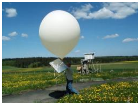
Balún aimsire á sheoladh

Tá ionstraimí éagsúla aimsire air, agus téann sé suas go hard sa spéir chun staid an atmaisféir a thaifeadh ag leibhéal éagsúla.