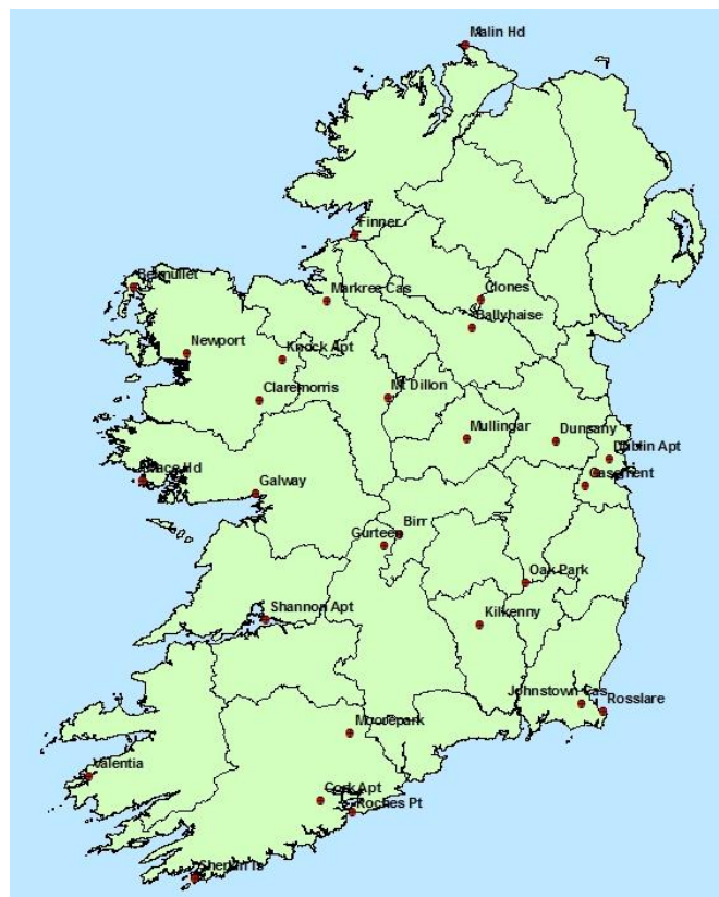
Léarscáil de stáisiúin aimsire in Éirinn

Is teanga uilíoch é an córas uimhrithe seo a thuigeann gach duine a bhíonn ag plé leis an aimsir.